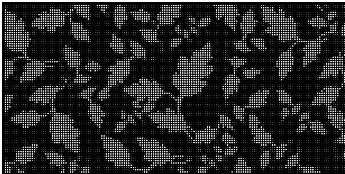
Format présenté : 1000 x 2000 mm

Idéal pour des garde-corps, des portails et des clôtures ou du mobilier.