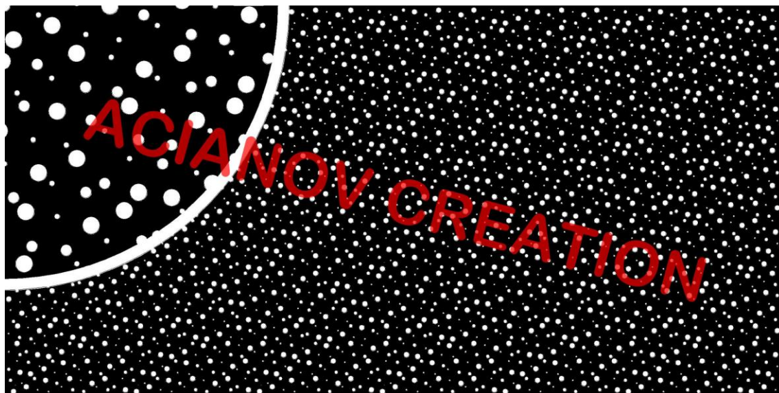
Format présenté : 1000 x 2000 mm (zoom échelle 3)

Image à votre format et en couleur (toutes les nuances RAL disponibles) sur simple demande à l'adresse : acianov@orange.fr