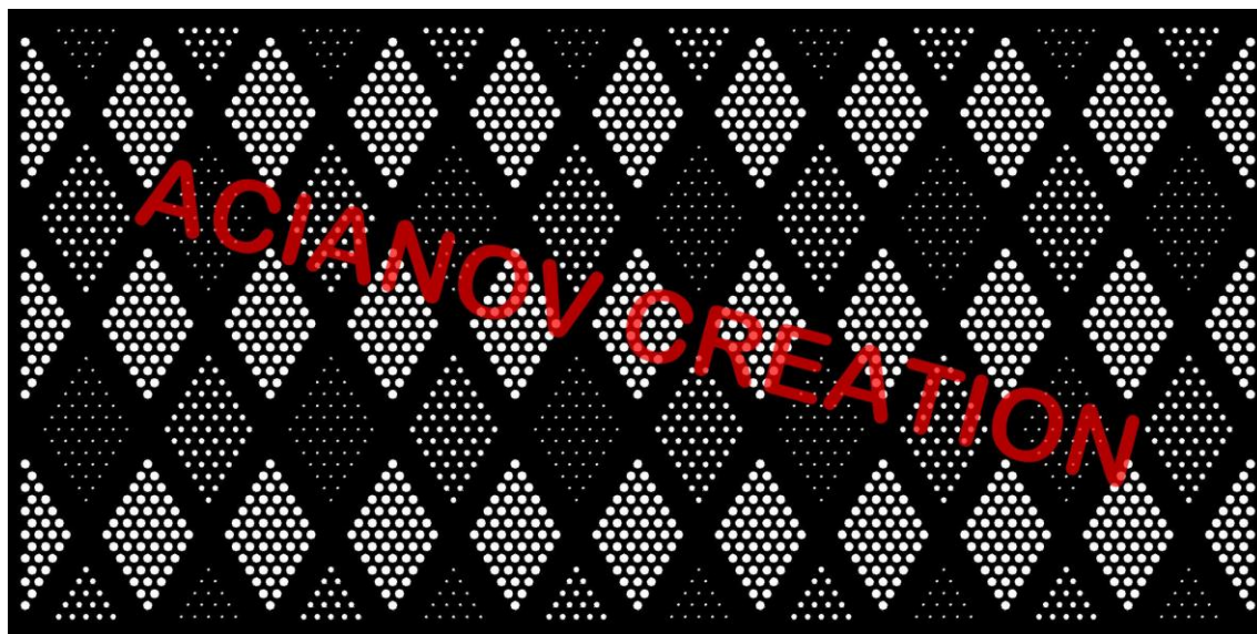
Format présenté : 1000 x 2000 mm

Image à votre format et en couleur (toutes les nuances RAL disponibles) sur simple demande à l'adresse : acianov@orange.fr