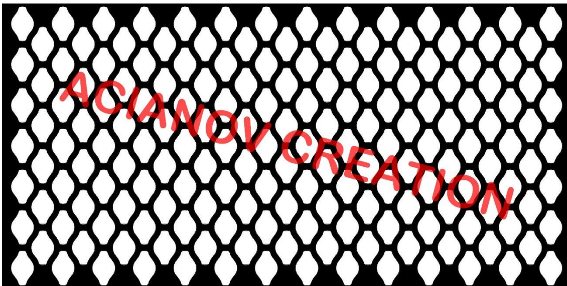
Format présenté : 1000 x 2000 mm

Image à votre format et en couleur (toutes les nuances RAL disponibles) sur simple demande à l'adresse : acianov@orange.fr