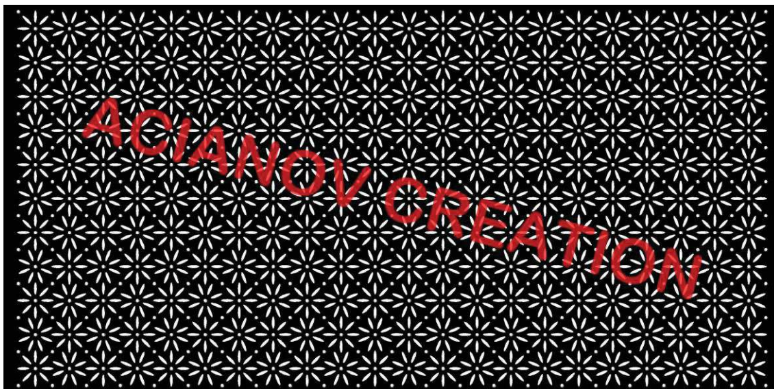
Format présenté : 1000 x 2000 mm

Image à votre format et en couleur (toutes les nuances RAL disponibles) sur simple demande à l'adresse : acianov@orange.fr