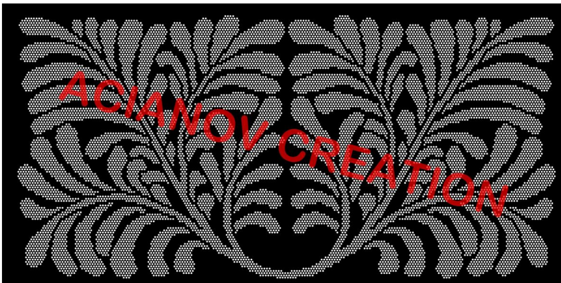
Format présenté : 1000 x 2000 mm

Image à votre format et en couleur (toutes les nuances RAL disponibles) sur simple demande à l'adresse : acianov@orange.fr