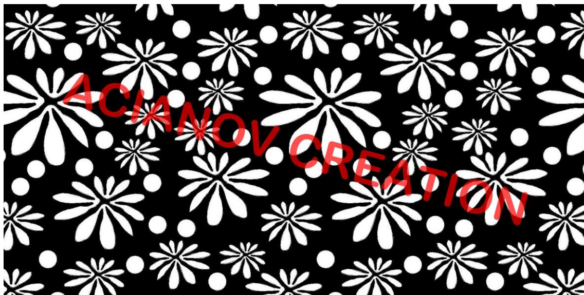
Format présenté : 1000 x 2000 mm

Image à votre format et en couleur (toutes les nuances RAL disponibles) sur simple demande à l'adresse : acianov@orange.fr