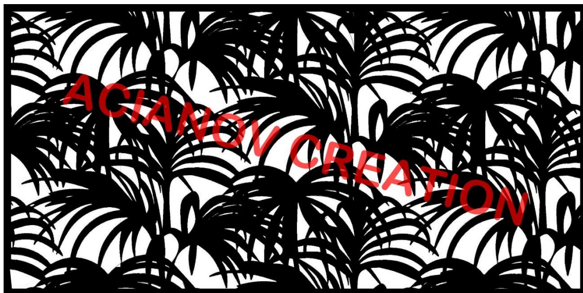
Format présenté : 1000 x 2000 mm

Image à votre format et en couleur (toutes les nuances RAL disponibles) sur simple demande à l'adresse : acianov@orange.fr