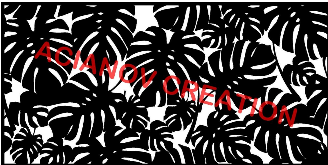
Format présenté : 1000 x 2000 mm

Image à votre format et en couleur (toutes les nuances RAL disponibles) sur simple demande à l'adresse : acianov@orange.fr