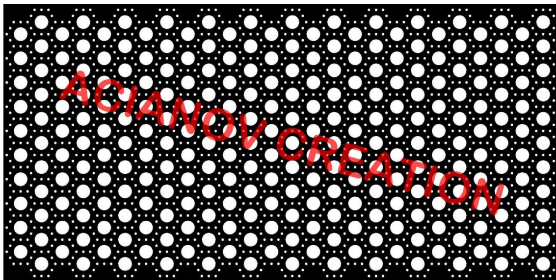
Format présenté : 1000 x 2000 mm

Image à votre format et en couleur (toutes les nuances RAL disponibles) sur simple demande à l'adresse : acianov@orange.fr