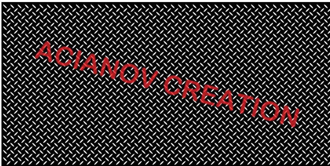
Format présenté : 1000 x 2000 mm

Image à votre format et en couleur (toutes les nuances RAL disponibles) sur simple demande à l'adresse : acianov@orange.fr