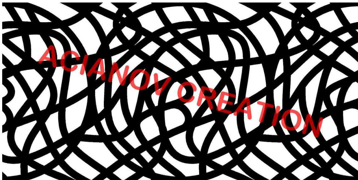
Format présenté : 1000 x 2000 mm

Image à votre format et en couleur (toutes les nuances RAL disponibles) sur simple demande à l'adresse : acianov@orange.fr