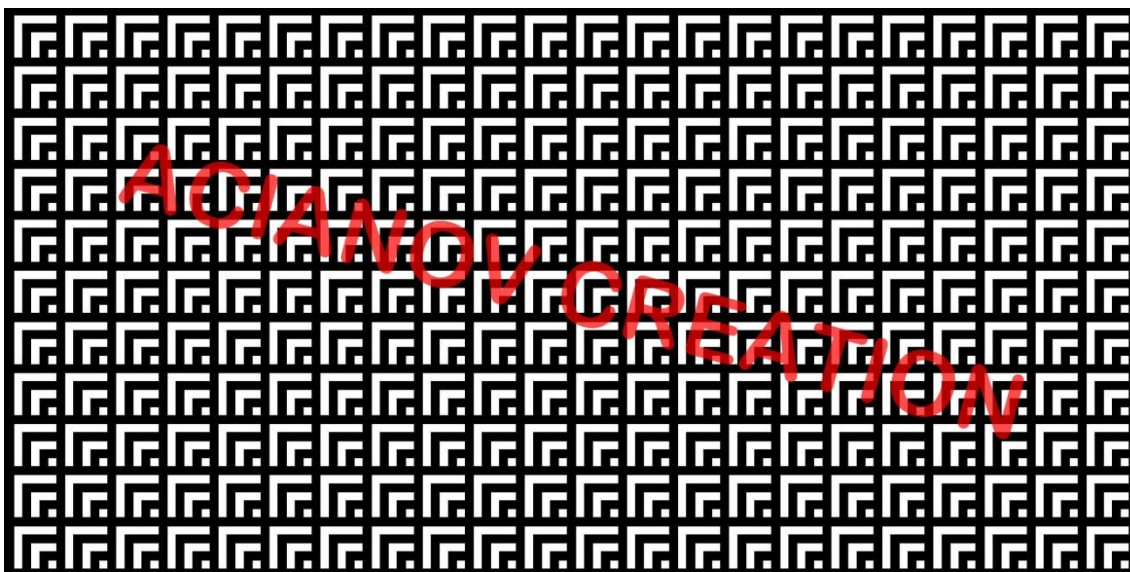
Format présenté : 1000 x 2000 mm

Image à votre format et en couleur (toutes les nuances RAL disponibles) sur simple demande à l'adresse : acianov@orange.fr