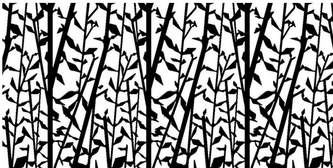
Format présenté : 1000 x 2000 mm