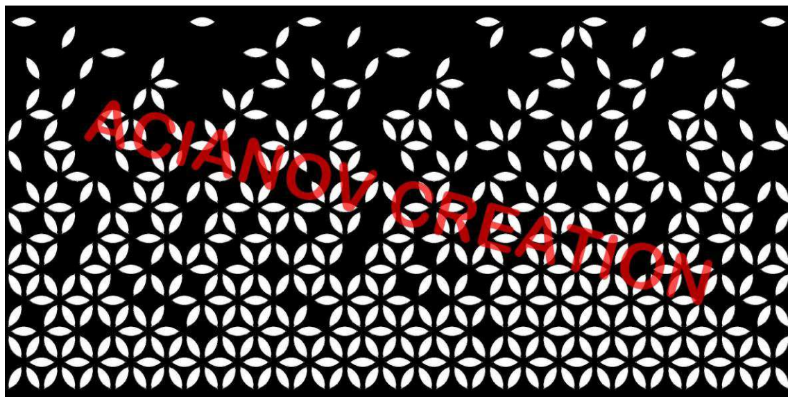
Format présenté : 1000 x 2000 mm

Image à votre format et en couleur (toutes les nuances RAL disponibles) sur simple demande à l'adresse : acianov@orange.fr