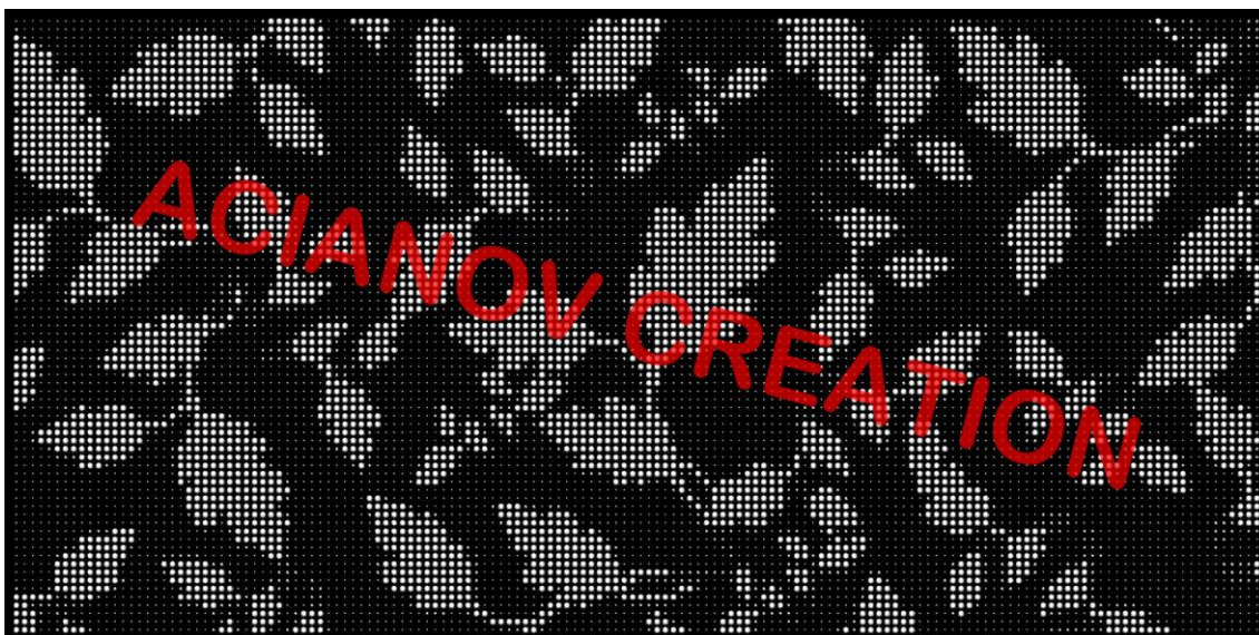
Format présenté : 1000 x 2000 mm

Image à votre format et en couleur (toutes les nuances RAL disponibles) sur simple demande à l'adresse : acianov@orange.fr